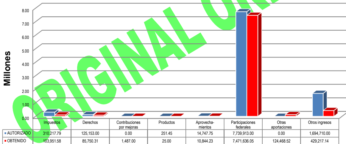
GRÁFICA 1 INGRESOS

Otras aportaciones: Rendimientos por bursatilización $124,468.52.